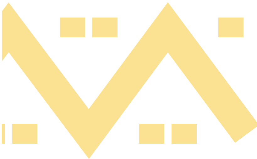
Greca diagonal para hojas y fotografías