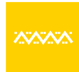
Icono para RRSS