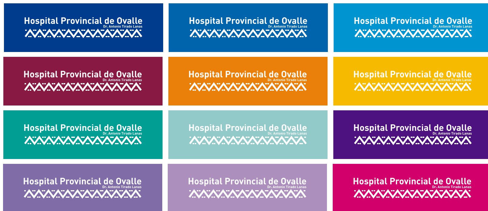
Colores complementarios con aplicación de isologo a un color